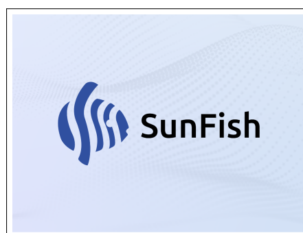
Gambar 2.2. Logo SunFish

Produk utama yang ditawarkan oleh DataOn adalah SunFish HR, yaitu aplikasi berbasis web untuk mengelola sumber daya manusia. Sistem ini menyediakan berbagai fitur, seperti payroll management , time management , human capital management , serta mendukung employee engagement , team collaboration , dan project management dalam satu platform. Integrasi tersebut membantu meningkatkan efisiensi operasional dan efektivitas pengelolaan SDM [6]. Logo SunFish dapat dilihat pada Gambar 2.2.