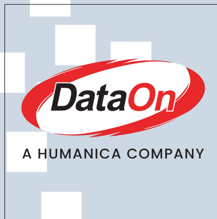
Gambar 2.1. Logo perusahaan DataOn

Selain itu, logo perusahaan DataOn dapat dilihat pada Gambar 2.1. Nama “DataOn” berasal dari filosofi “Data Online”, yang mencerminkan keyakinan para pendiri bahwa solusi berbasis web akan menjadi kebutuhan di masa depan. Filosofi tersebut menjadi dasar bagi perusahaan dalam mengembangkan berbagai solusi teknologi informasi yang berfokus pada kemudahan akses, efisiensi, dan fleksibilitas melalui platform digital [3].