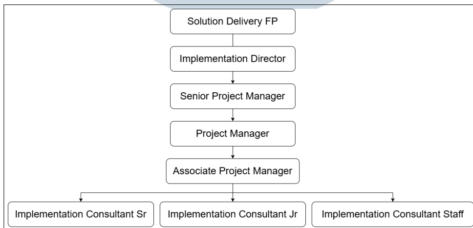
Gambar 2.6. Struktur departemen solution delivery FP di PT. Indodev Niaga Internet

Pelaksanaan kegiatan magang dilakukan pada sub departemen Solution Delivery FP dengan posisi sebagai Implementation Consultant Junior Intern . Dalam pelaksanaannya, kegiatan tersebut berada di bawah supervisi langsung oleh Associate Project Manager sebagai direct supervisor , serta berada dalam koordinasi Senior Project Manager sebagai manajer. Sub departemen Solution Delivery FP difokuskan pada proses implementasi dan kustomisasi sistem SunFish 6 maupun SunFish 7 kepada pelanggan dalam negeri. Struktur Solution Delivery FP dapat dilihat pada Gambar 2.6