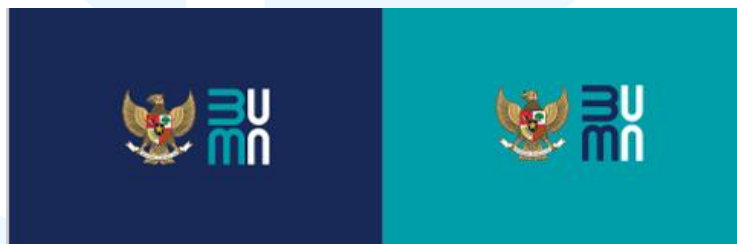
Gambar 2.3 Logo Baru BUMN

Pada tanggal 1 Juli 2020, Kementerian Badan Usaha Milik Negara Republik Indonesia (BUMN) meluncurkan identitas baru mereka sebagai bagian dari inisiatif transformasi dalam mempersiapkan seluruh BUMN untuk bersaing di pasar global yang semakin kompetitif. Celsius Creative Lab mendapatkan kesempatan untuk merancang identitas baru ini, yang mencerminkan semangat progresif dan modern sekaligus mempertahankan daya tarik otoritatif dari sebuah lembaga pemerintah resmi.