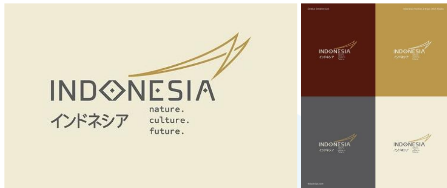
Gambar 2.5 Brand Identity Indonesia Pavilion untuk Expo 2025 Osaka

Branding yang dibuat Celsius untuk Indonesia Pavilion di Expo 2025 Osaka berakar pada filosofi “ form follows memory ”. Identitas ini menjembatani kearifan leluhur dengan kemajuan modern, mengambil inspirasi logotype dari salah satu simbol ikonik, Aksara Lontara. Aksara Lontara melambangkan sebuah gerbang menuju pengetahuan dan kearifan kuno. Lebih dari sekadar bentuk tulisan, Aksara Lontara membawa kisah tentang arah, ketahanan, dan kearifan budaya. Semangat yang sama kini hidup kembali melalui logo Indonesia Pavilion; melambangkan perjalanan yang dibentuk oleh alam, budaya, dan visi untuk masa depan.