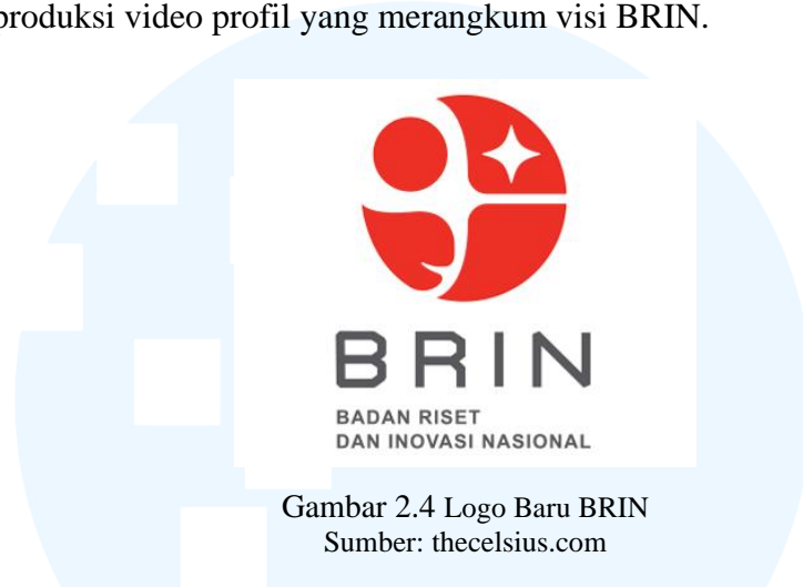
Gambar 2.4 Logo Baru BRIN

penemuan dan inovasi, administrasi nuklir, dan administrasi ruang angkasa. Pada tahun 2021, Celsius Creative Lab merancang brand identity yang untuk BRIN. Hal ini termasuk mendesain logo baru, membuat tagline , dan memproduksi video profil yang merangkum visi BRIN.