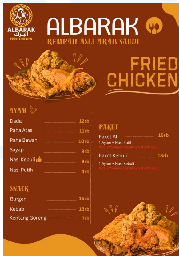
Gambar 2.3 Portofolio Badan Usaha

AKB Signature merupakan badan usaha yang bergerak dibidang desain grafis yang berfokus pada pembuatan identitas visual dan kebutuhan desain untuk berbagai keperluan secara bisnis atau personal. Sebagai badan usaha desain grafis, AKB Signature memiliki beberapa karya yang menjadi portofolio badan usaha. Portofolio tersebut terdapat desain logo, desain media promosi seperti poster, dan konten media sosial. Dengan adanya portofolio tersebut dapat menampilkan bahwa badan usaha AKB Signature merupakan badan usaha yang pantas.