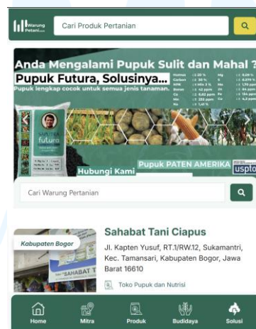
Gambar 2.4 Website Warung Petani

Website Bursatani merupakan sebuah media informasi dan konsultasi, website bertujuan untuk membantu para pengguna untuk melakukan kegiatan pertanian dan perkebunan dengan menyediakan panduan budidaya berbagai jenis tanaman. Website juga menyediakan penjelasan produk Pupuk Batu Bara Futura dan produk pendukung lainnya, terdapat juga fitur jaringan toko yang bertujuan untuk memudahkan para pengguna mengetahui dimana saja mereka dapat menemukan produk-produk tersebut.