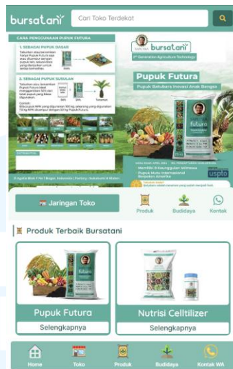
Gambar 2.3 Website Bursatani

Website Bursatani merupakan sebuah media informasi dan konsultasi, website bertujuan untuk membantu para pengguna untuk melakukan kegiatan pertanian dan perkebunan dengan menyediakan panduan budidaya berbagai jenis tanaman. Website juga menyediakan penjelasan produk Pupuk Batu Bara Futura dan produk pendukung lainnya, terdapat juga fitur jaringan toko yang bertujuan untuk memudahkan para pengguna mengetahui dimana saja mereka dapat menemukan produk-produk tersebut.