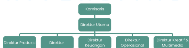
Gambar 2.2 Struktur Organisasi Perusahaan

Struktur organisasi perusahaan PT Bursatani Global Niaga terdiri dari 7 bagian dengan komisaris yang berada di puncak sebagai pengawas yang berperan untuk memastikan keberlangsungan perusahaan berjalan sesuai dengan visi, misi, dan mematuhi hukum, komisaris perusahaan juga berperan sebagai ketua umum dalam pendirian perusahaan.