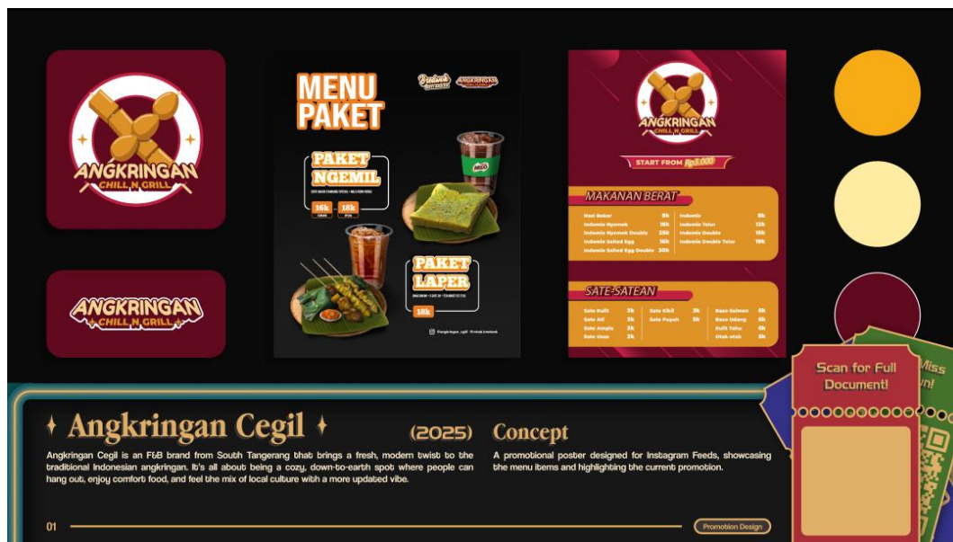
Gambar 2.3 Angkringan Cegil

Angkringan Cegil merupakan brand yang bergerak pada bidang FnB di Tangerang Selatan. Pada proyek ini, Cokinus Creative bertanggung jawab pada pembuatan dan penguatan branding dari Angkringan Cegil, mulai dari logo, pemilihan warna, tipografi, dan juga kebutuhan promosinya. Proyek ini dikerjakan pada 2025, sebelum Cokinus Creative resmi berdiri sebagai sebuah studio desain.