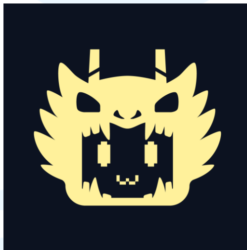
Gambar 2.1 Logo Cokinus Creative

Cokinus Creative merupakan studio desain yang didirikan pada Februari 2026 dengan tujuan memberikan layanan desain branding dan promosi. Cokinus Creative menjadi jawaban untuk kebutuhan pelaku usaha yang membutuhkan desain branding untuk mereknya ataupun desain promosi untuk media fisik dan juga digital (media sosial seperti Instagram dan Tiktok).