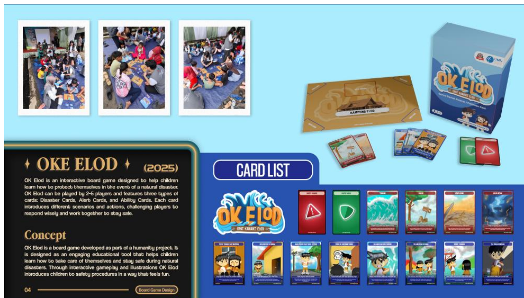
Gambar 2.5 Opat Kawani Elod

Cokinus Creative bertanggung jawab dalam membuat ilustrasi, logo, bentuk kartu, hingga desain dan packaging dari OK Elod. Setiap desain yang dibuat disesuaikan dengan kebutuhan pengguna, yaitu anak-anak, sehingga ilustrasi yang dibuat akan lebih ke arah style kartun.