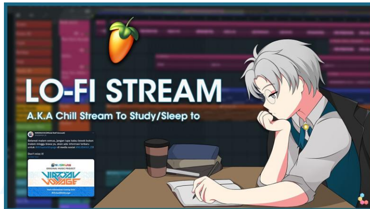
Gambar 2.2 Thumbnail YouTube Untuk VTuber Eric Sanjaya CH . Sumber: https://x.com/ricsemptydiary (2021)

Dalam perkembangannya selama beberapa tahun terakhir, Rayasuni telah melayani klien dari berbagai latar belakang. Karya yang dihasilkan digunakan untuk beragam kebutuhan, baik untuk kepentingan pribadi maupun komersial. Klien yang dilayani mencakup individu umum, kreator digital seperti VTuber , hingga pelaku usaha yang membutuhkan aset visual untuk berbagai media. Bentuk output dari jasa yang dihasilkan mencakup karya seperti ilustrasi potret karakter serta berbagai aset visual yang dapat digunakan pada beragam platform dan kebutuhan media lainnya.