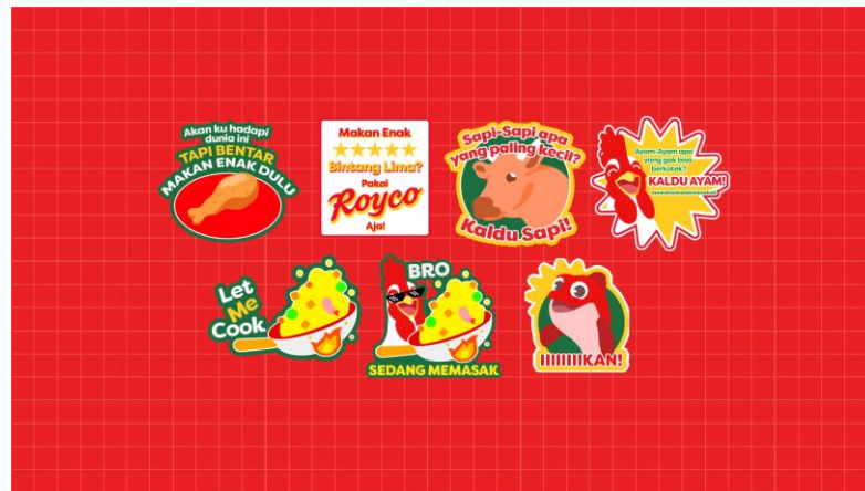
Gambar 2.4 Desain Stiker Maskot Royco

perancangan desain dan pembuatan aset visual untuk merek makanan seperti Cornetto, Royco, dan Bango.