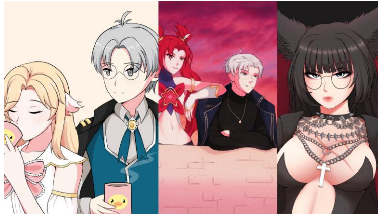
Gambar 2.5 Ilustrasi karakter untuk Eric Sanjaya dan NyxAsterion

Karya-karya yang dipaparkan diatas merupakan hasil kerjasama antara VTuber dan Rayasuni yang berupa ilustrasi karakter. Kedua VTuber tersebut memerlukan ilustrasi untuk kepentingan channel YouTube dan social media . Ilustrasi tersebut dikerjakan menggunakan gaya ilustrasi anime dan menampilkan tokoh VTuber masing-masing, yakni karakter Eric Sanjaya dan NyxAsterion. Setiap VTuber , sebagai klien, mengajukan permintaan kepada Rayasuni dengan membawa ide dan konsep awal. Melalui proses perancangan yang dilakukan, Rayasuni menerjemahkan konsep tersebut ke dalam bentuk visual yang sesuai dengan kebutuhan dan identitas klien.