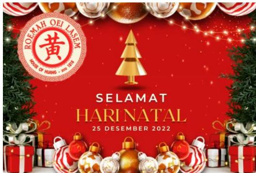
Gambar 2.6 Unggahan Ucapan Selamat Natal

Roemah Oei juga memiliki unggahan Instagram lainnya berupa ucapan selamat hari natal dengan penggunaan elemen visual atau gambar ilustratif yang cenderung umum, disertai dengan salah satu variasi utama logo Roemah Oei. Selain unggahan berupa ucapan hari raya, terdapat beberapa unggahan promosi lainnya dengan informasi mengenai keterangan fasilitas yang tersedia, harga dan kontak untuk penginapan Wisma Pamilie dilengkapi dengan elemen sederhana yang terdiri atas foto asli beberapa teks yang kurang konsisten, disertai dengan salah satu variasi logo lain yang menyerupai stempel Roemah Oei.