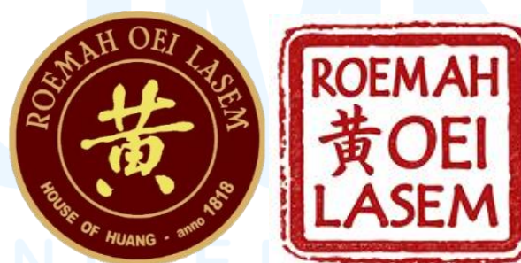
Gambar 2.2 Logo Variasi Sekunder Roemah Oei Sumber: Roemah Oei Lasem (2026)

Dalam konteks identitas perusahaan, Roemah Oei saat ini belum memiliki satu logo utama yang konsisten dalam merepresentasikan identitas perusahaan. Terdapat beberapa versi bentuk logo yang digunakan pada berbagai media secara tidak konsisten baik pada ranah digital maupun non-digital. Logo yang ditampilkan secara resmi bertuliskan “Roemah Oei Lasem” yang disertai dengan aksara Tionghoa “黄” yang dalam pelafalan Mandarin dibaca sebagai Huang, namun dalam dialek Hokkian atau penulisan lama sering kali tertulis sebagai Oei pada bangunan rumah, disertai dengan elemen motif banji yang melingkar. Adapun variasi logo untuk penginapan dengan elemen utama yang sama, namun dengan tambahan “Wisma Pamilie” serta posisi elemen motif banji melingkar yang berpindah ke dalam lingkaran garis luar.