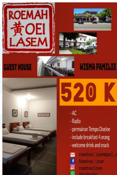
Gambar 2.7 Unggahan Promosi Wisma Pamilie

Roemah Oei juga memiliki unggahan Instagram lainnya berupa ucapan selamat hari natal dengan penggunaan elemen visual atau gambar ilustratif yang cenderung umum, disertai dengan salah satu variasi utama logo Roemah Oei. Selain unggahan berupa ucapan hari raya, terdapat beberapa unggahan promosi lainnya dengan informasi mengenai keterangan fasilitas yang tersedia, harga dan kontak untuk penginapan Wisma Pamilie dilengkapi dengan elemen sederhana yang terdiri atas foto asli beberapa teks yang kurang konsisten, disertai dengan salah satu variasi logo lain yang menyerupai stempel Roemah Oei.