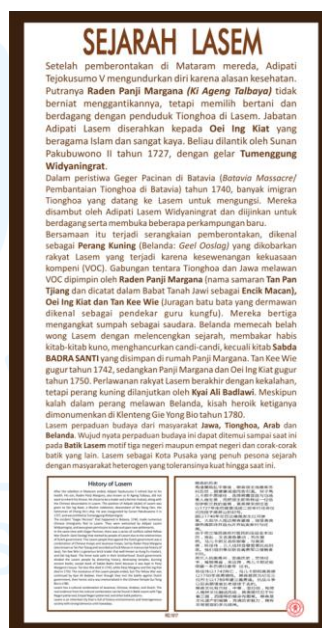
Gambar 2.4 Poster Sejarah Lasem

Namun, bentuk media yang tersedia saat ini masih bersifat sederhana dan belum mengalami pembaruan yang signifikan, salah satunya adalah poster yang ditempatkan di berbagai area bangunan Roemah Oei. Poster ini berfungsi sebagai media edukasi bagi pengunjung dengan menyajikan informasi mengenai sejarah Lasem sebagai Kota Pusaka yang penuh warisan sejarah dengan masyarakat heterogen yang memiliki budaya toleransi hingga saat ini dengan akulturasi budaya dari masyarakat Jawa, Tionghoa, Arab dan Belanda.