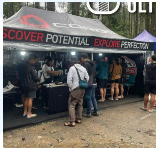
Gambar 2.3 Booth kolaborasi COROS dan WIA

COROS bekerja sama dengan WIA untuk melakukan kegiatan promosi di Siksorogo Lawu Ultra yang merupakan salah satu acara lomba lari trail yang dibuka secara internasional yang diadakan setiap akhir tahun dan diadakan di area lereng Gunung Lawu.