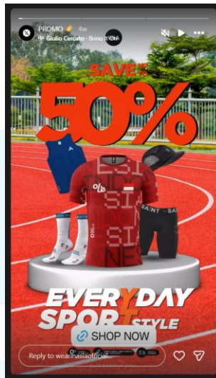
Gambar 2.6 Desain Instagram Story

Promo ini didesain dengan format Instagram story berukuran 16:9 dengan menggunakan video motion untuk mempromosikan produknya, pada promo ini terdapat beberapa produk kategori activeware yang menginformasikan potongan harga sebesar 50% pada produk produk yang tampilkan pada desain Instagram Story tersebut dengan judul campaign Everyday Sport Style dan tertera tautan yang dapat terhubung langsung pada situs berbelanja resmi WIA.