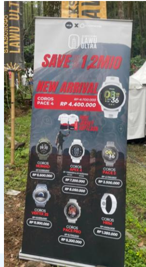
Gambar 2.5 Desain X-Banner WIA

Tidak hanya itu, WIA juga medesain media promosional cetak dengan menggunakan X-Banner berukuran 200 x 80 cm untuk menginformasikan terkait produk terbaru dari COROS dan promo-promo produk COROS yang dijual oleh WIA pada acara acara Siksorogo Lawu Ultra. Desain X-banner ini diletakan pada bagian depan booth agar dapat menarik perhatian pelari terhadap promo potongan harga yang ditawarkan oleh WIA.