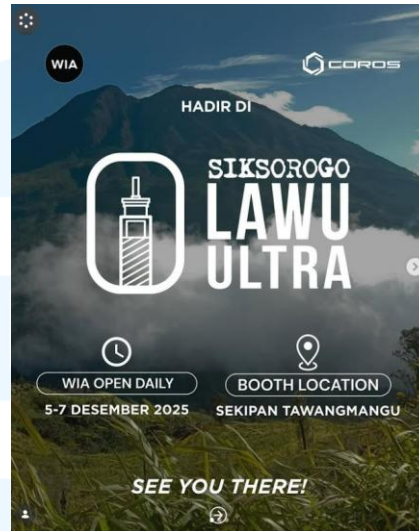
Gambar 2.4 Desain Instagram post WIA

memanfaatkan aplikasi instagram dan juga offline dengan menggunakan media cetak seperti banner dan juga poster.