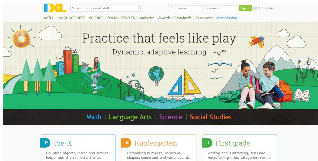
Gambar 3.3. IXL Homepage