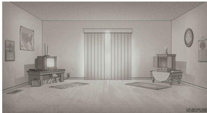
Gambar 1.2. Environment apartement

bentrok dua kultur. Kemudian ada dua bentuk properti yang dibuat kontras yaitu TV yang bergaris lurus dan tempat ibadah dibuat dengan garis lengkung. Dalam film pendek ini penonton dikenalkan dua budaya secara singkat lewat establishing shot. Hanya sekedar menunjukkan environment tanpa penjelasan langsung dalam cerita, environment dapat menceritakan tokoh yang hidup didalamnya. Ini menjadi suatu kekuatan dalam bercerita menggunakan visual. Dalam satu shot penonton menjadi cepat menangkap dimana dan apa yang terjadi di dalamnya.