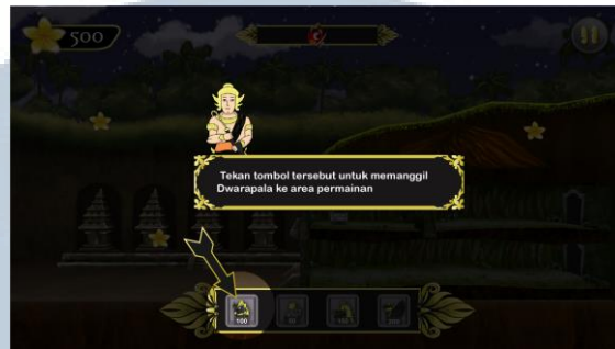
Gambar 5.5. Tutorial interaktif