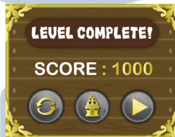
Gambar 5.4. Score board