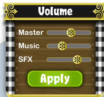
Gambar 5.2. Complete Setting