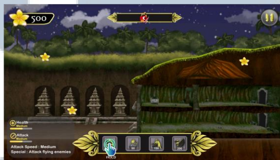
Gambar 5.6. Status tower in-game

U M N U N I V E R S I T A S M U L T I M E D I A N U S A N T A R A